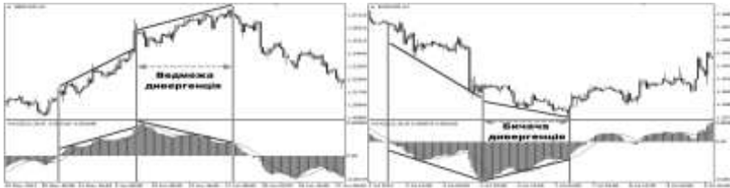
Рис. 1. Звичайна ведмежа та бичача дивергенції

Щоб визначити на ринку ведмежу дивергенцію, трейдер повинен поглянути на максимальні значення ціни, а також на відповідний індикатор. Класична ведмежа дивергенція спостерігатиметься тоді, коли виконуватимуться певні умови: на графіку ціни має з'явитися високий максимум, індикатор має показати нижчий максимум. Для визначення класичної бичачої дивергенції слід звертати увагу на мінімуми графіка, а також індикатора. Якщо на ринку є звичайна бичача дивергенція, тоді японські свічки намалюють нижчу ціну, а індикатор навпаки – вищий мінімум. У такому випадку варто очікувати висхідного руху, тобто трейдеру потрібно приготуватися до купівель.