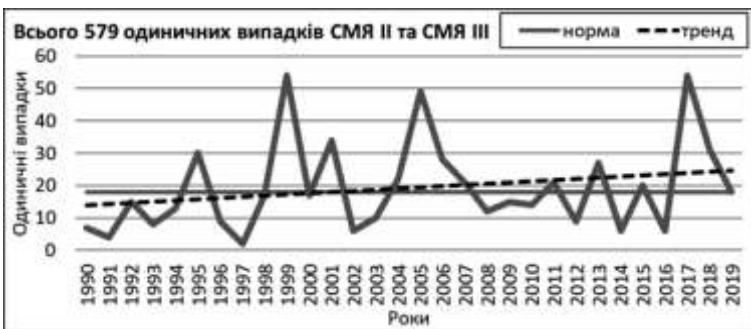
Рис. 1. Повторюваність всіх сильних та надзвичайних снігопадів

Кількість одиничних та систематизованих випадків з року в рік суттєво змінюється і може сягати 37-48 одиничних випадків, як наприклад між 1998-1999 рр. та 2016-2017 рр. Найбільше сильних та надзвичайних снігопадів було зафіксовано у 1999 та 2017 роках – по 54 одиничні випадки, а найменше – у 1991 (4 одиничні випадки) та 1997 (2 одиничні випадки) роках. В першому десятиріччі (1990-1999 рр.) було зафіксовано 159 одиничних випадків сильних і надзвичайних снігопадів, а в другому (2000-2009 рр.) – 214, третьому (2010-2019 рр.) – 206. Спостерігається тенденція до збільшення кількості сильних та надзвичайних снігопадів впродовж досліджуваного періоду, а отже збільшується їх повторюваність та частота випадання. Частішання одиничних випадків снігопадів критеріїв СМЯ II та СМЯ III свідчить про збільшення площ їх випадання, так як в загальному, кількість випадків не змінилася. Аналіз багаторічних коливань повторюваності одиничних випадків сильних та надзвичайних снігопадів (рис. 1) показав, починаючи з 1999 року, наявність 6-річних ритмів, під час яких спостерігалися пікові значення повторюваності. Звичайно, кількісно максимуми не співпадали, але характер амплітуди був подібний.