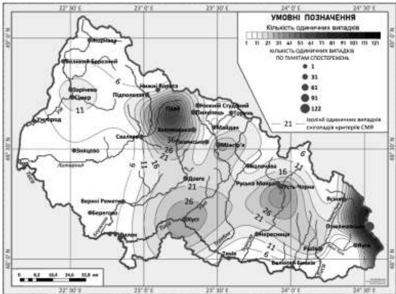
Рис. 2. Повторюваність одиничних випадків сильних та надзвичайних снігопадів на Закарпатті за 1990-2019 рр.

Навесні та восени площі поширення сильних та надзвичайних снігопадів різко скорочуються. При цьому зберігаються дві основні зони максимальної повторюваності: гірський хребет Черногора (37-39 одиничних випадків) та Полонина Боржава (18-19 одиничних випадків за тридцятиріччя).