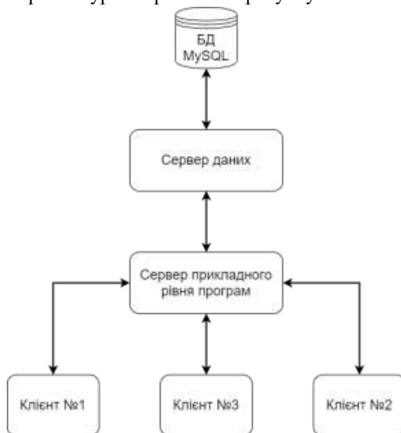
Рисунок 2 – Схема клієнт-серверної архітектури

стилів CSS та вільному наборі інструментів Bootstrap. Передбачається, що цей сайт буде доступний через локальну мережу в рамках університету на спеціальних персональних комп'ютерах розміщених в холах корпусів, формуючи таким чином майже автономний термінал інформаційної підтримки студентів. Це забезпечить зручність в користуванні для студентів, що відвідують навчальний заклад, а також зменшить затрати часу на оновлення інформації для відповідальних працівників ВУЗів. Так як доступ до API серверу можливо зробити доступним з мережі Інтернет це дозволить, при додатковій реалізації публічних ресурсів(сайтів, мобільних додатків тощо), отримувати доступ до індивідуального розкладу студентам на дистанційному навчанні. Схема клієнт-серверної архітектури зображена на рисунку 2.