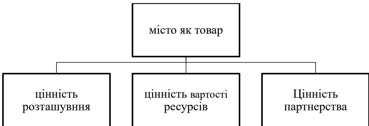
Рис. 1. Характеристика міста як товару*

У загальному вигляді місто як товар необхідно розглядати у якості набору конкретних цінностей, набуття ("купівля") яких розглядається потенційними їх покупцями як отримання певної вигоди. Умовно конкретні цінності можна згрупувати в комплекс загальних цінностей (див. рис. 1).