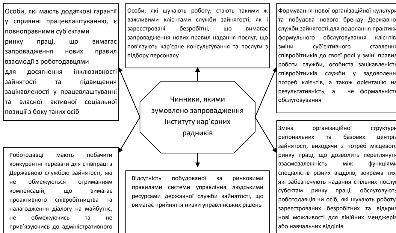
Рис. 1. Вплив чинників, які зумовили запровадження Інституту кар'єрних радників [7]