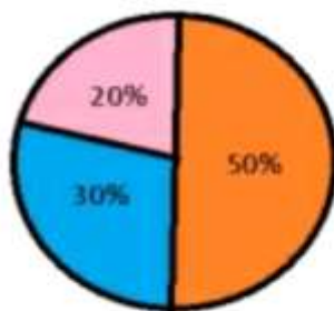
Рис. 1. Результати анкетування

З метою визначення ефективності застосування різних видів наочності та задоволення учнів від їх використання в освітньому процесі молодших школярів, було проведено анкетування учнів. На основі даного анкетування можна зробити висновок, що рівень задоволення використання наочності у початковій школі: 20% низький, 50% середній, 30% високий.