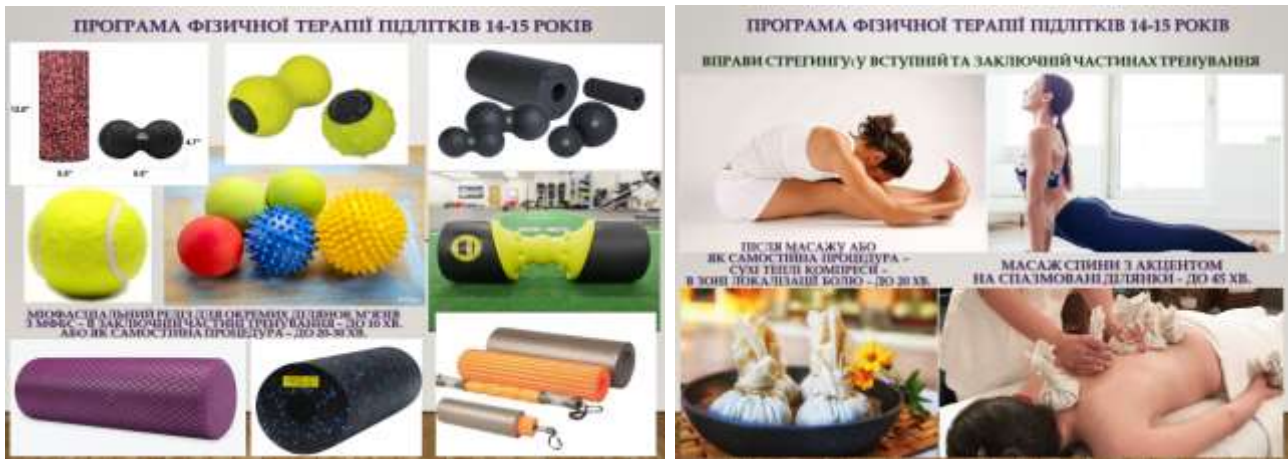
Рис. 1 Комплексні складові програми ФТ підлітків 14-15 років з міофасціальною дисфункцією внаслідок порушень постави

ФТ може бути використаний в сучасних програмах як самостійний елемент, так і як ефективна складова комплексної програми фізичної терапії» [11, с. 105].