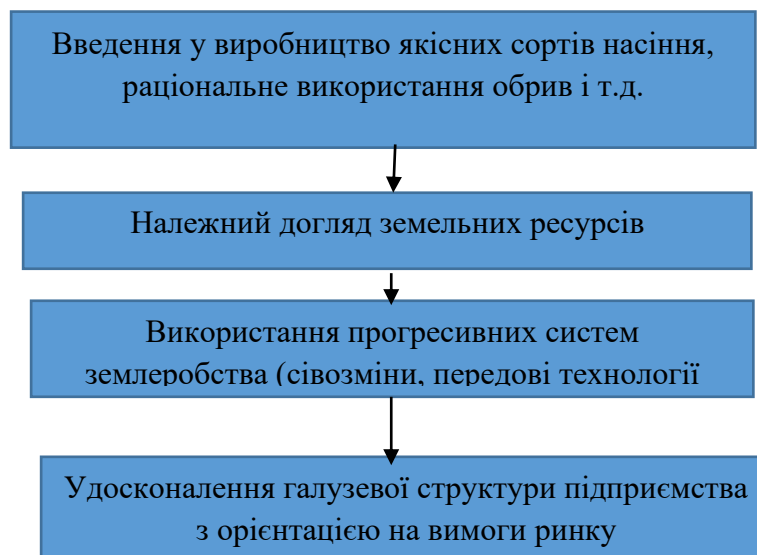
Рис. 1. Основні фактори зниження собівартості сільськогосподарської продукції

Підсумовуючи, виділимо основні фактори зниження собівартості (рис 1).